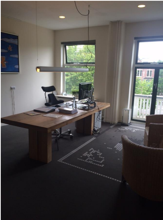
Directie kantoor aan de voorkant