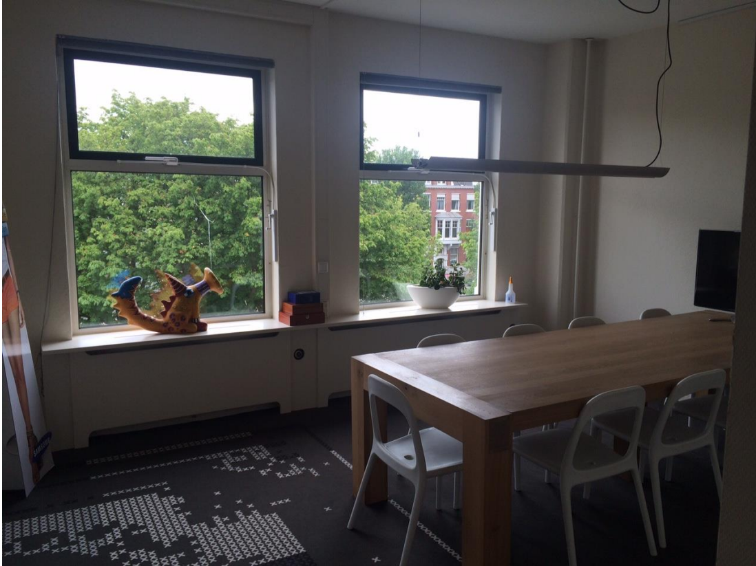
Vergaderkamer aan de zijde van de Koninginnegracht