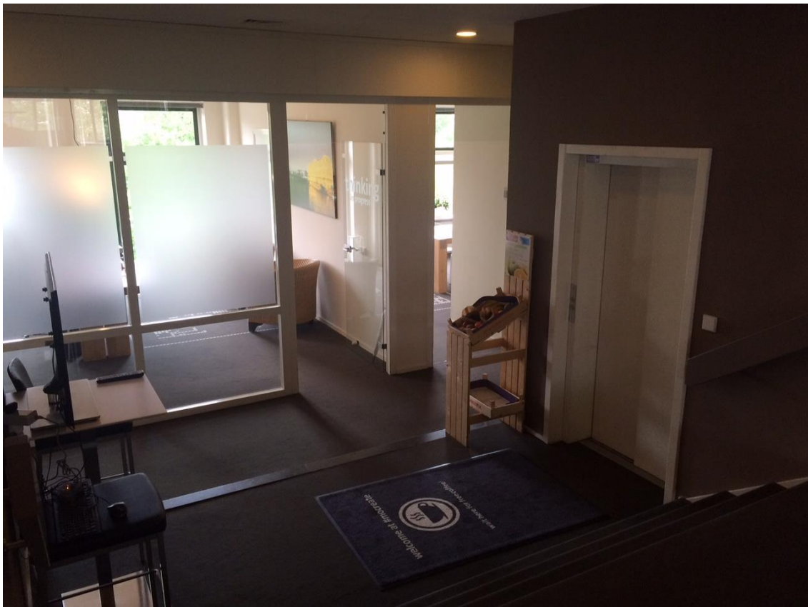
Hal kantoor op 3 e verdieping, directe toegang via afsluitbare lift.