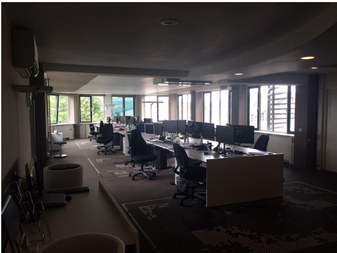
Grote ruimte, met in deze ruimte 16 werkplekken (totaal nu 22)