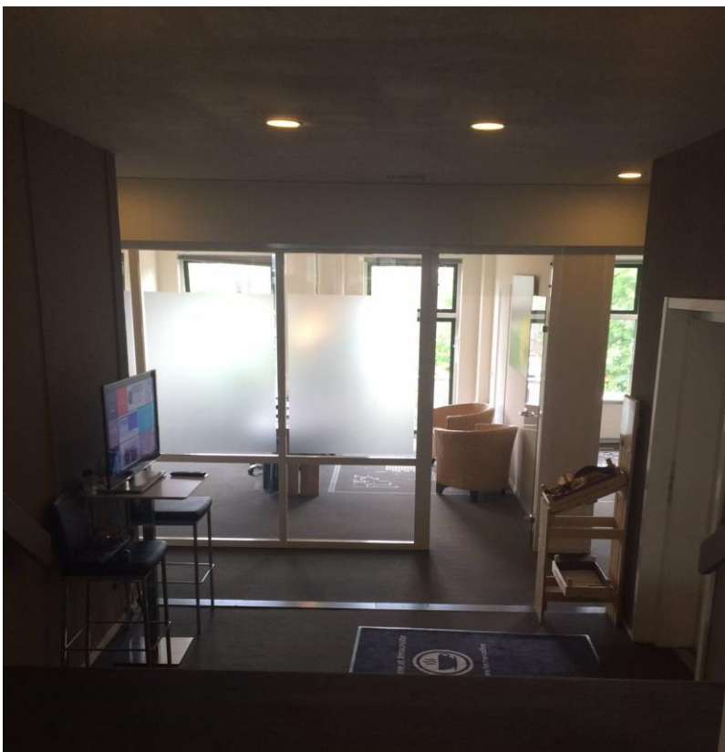
Hal met zicht op de directiekamer en aan de rechterkant de vergaderkamer