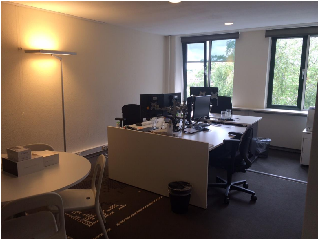
Werkkamer met 3 werkplekken aan de achterzijde van het gebouw